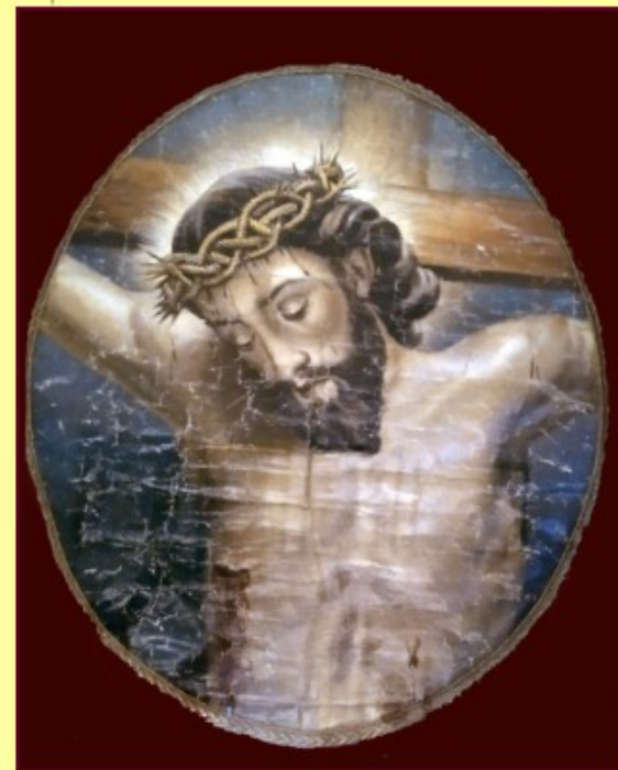
Medallón antiguo del estandarte de la Hermandad Cristo del Perdón, pintado al óleo por José María Almela Costa